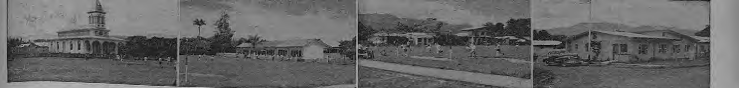
DE IZQUIERDA A DERECHA: LA IGLESIA, LA ESCUELA, LA PLAZA DE DEPORTES, CON MUCHACHOS JUGANDO, Y FINALMENTE, UNA BONITA RESIDENCIA DE LA LOCALIDAD.