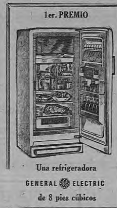
Una refrigeradora GENERAL ELECTRIC de 8 pies cúbicos

ALFREDO ESQUIVEL & CIA. LTD., OBSEQUIARA a sus clientes estos tres magníficos premios que entregará al portador de las acciones cuya número y serie correspondan al 1º, 2º y 3er. premio de la Lotería del 30 DE DICIEMBRE DE 1956.