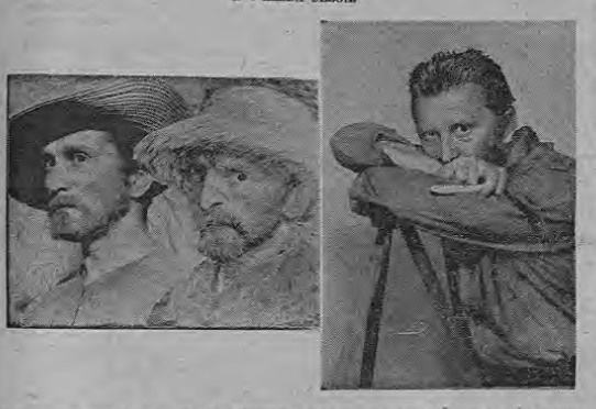
Kirk Douglas se superó en su genial interpretación del famoso pintor Van Gogh. A la izquierda, una comparación de un auto-retrato del pintor con la caracterización de Douglas. El parecido es notable.

PROTAGONIZADA POR EL FORMIDABLE ACTOR DRAMATICO, KIRK DOUGLAS... REPRODUCCIONES AUTENTICAS DE LAS GRANDES OBRAS DEL GENIAL PINTOR IMPRESIONISTA