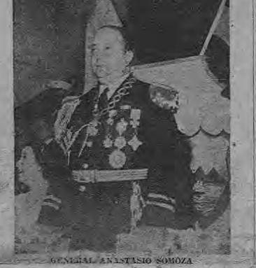
GENERAL ANASTASIO SOMOZA

—DESDE MANAGUA SE INFORMA QUE LA CAPITAL SE ENCONTRABA AYER EN PERFECTA CALMA, LO MISMO QUE EL RESTO DEL PAIS. LOS BANCOS, EL COMERCIO Y LAS OFICINAS PUBLICAS FUNCIONARON NORMALMENTE —El nuevo Presidente emitió ayer un comunicado en que da cuenta de la muerte del Presidente diciendo: "En estas horas de prueba para Nicaragua, hago un fervoroso llamamiento a la ciudadanía para que continúe manteniendo su alto espíritu de serenidad y patriotismo"