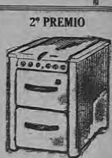
Una cocina alemana "G K A E T Z" de 2 calorificos y horno

Se obsequiará una acción por cada $ 10.00 de compra y de abono a cuenta corriente.