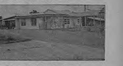
EL MAGNIFICO EDIFICIO DE LA LAVANDERIA "LA MARGARITA"; UN ESTABLECIMIENTO COMERCIAL, UNO DE LOS BARRIOS Y LA FABRICA DE TUBOS Y OTROS PRODUCTOS DE CONCRETO.