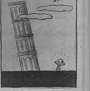
Don P.P.—Y yo traeré a los técnicos del MOP para que enderecen esta torcida!